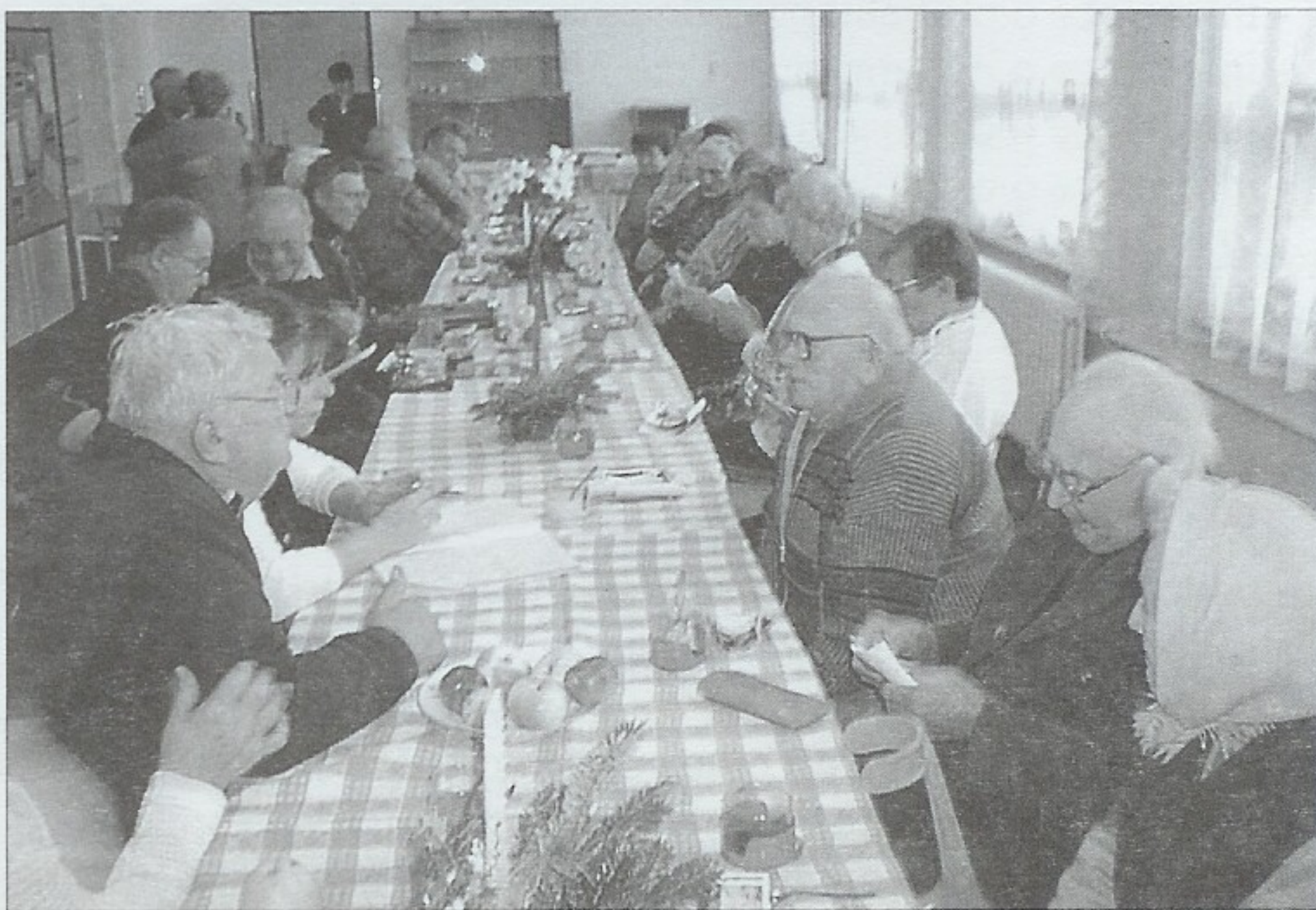
Besedovat nad kronikou obce přišlo padesát občanů.

V příštím roce 2004 proběhne v naší obci Tříkrálová sbírka pro Charitu v Uherském Hradišti. Spoluobčany budou obcházet se zapečetěnou pokladničkou tři králové v doprovodu člena zastupitelstva. S výsledkem sbírky pak budete informováni místním rozhlasem a také tiskem.