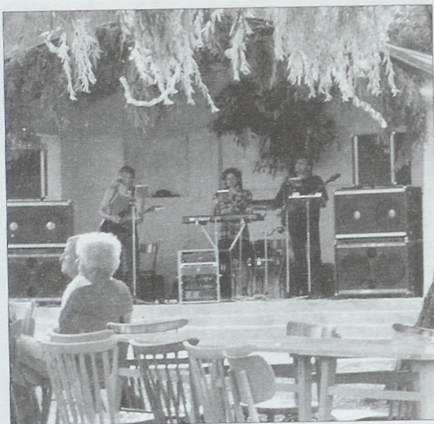
Trinom nízká účast mrzela, přesto skupina neodmítne další pozvání pořadatelů.