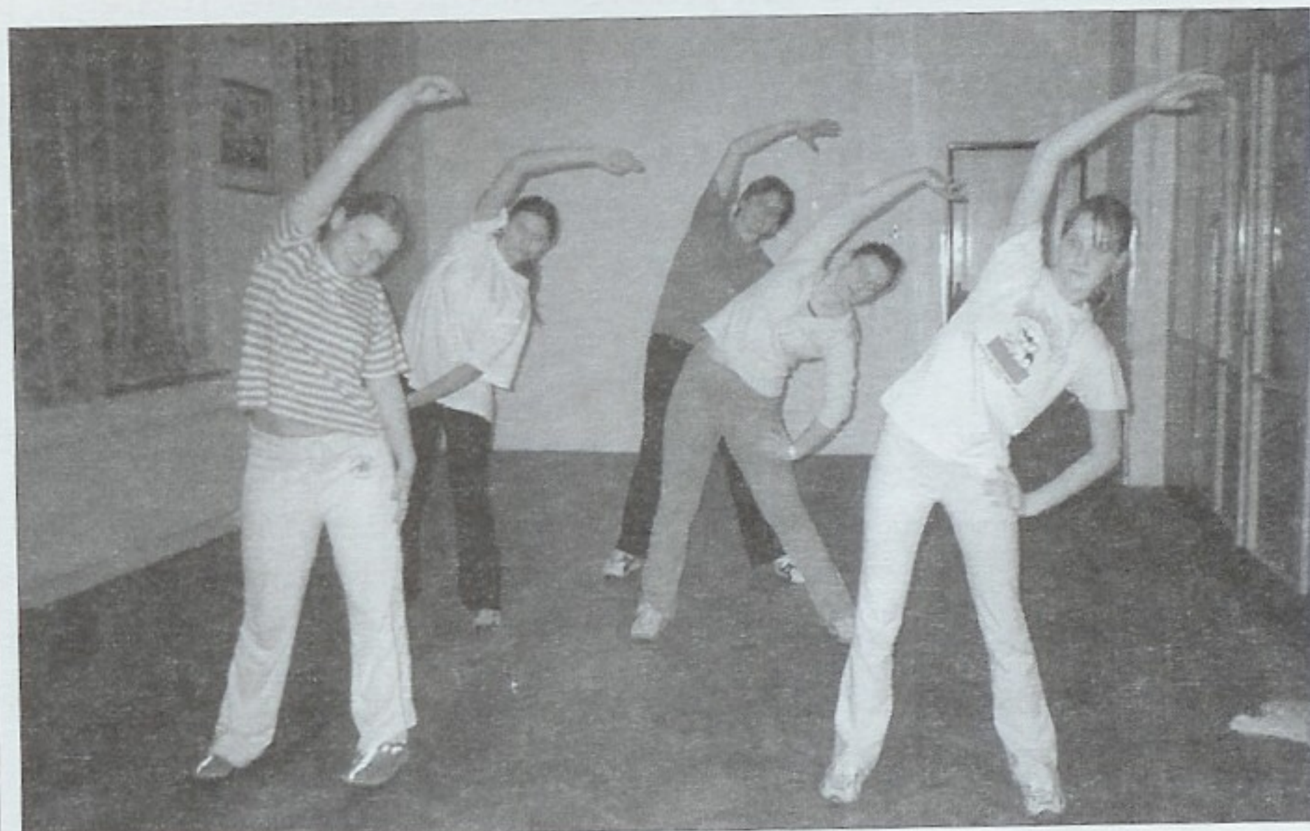
Počet žen se ve cvičení ustálil na sedm.

Možnosti volného sálu využili také kluci a začali tady hrát floorball. Nejprve hráli ve třech na vyrobenou branku. Druhou branku si pak přichystali ze stolu a žíněnek. Teď se kluků schází stále víc a dokonce už mezi nima nechyběl