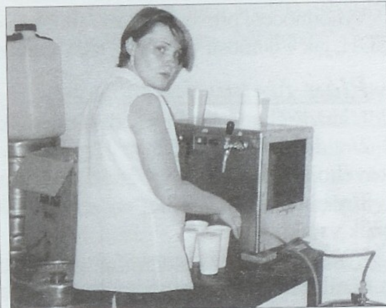
Na obou akcích se čepovalo osvědčené Starobrno.

V sobotu 2. srpna se konala ve výletišti Hliník akce s názvem Letní večer. Prezentovala se zde začínající kapela Stará škola. Její repertoár byl hlavně rock a blues. K tanci a poslechu navíc zněla reprodukovávaná hudba. Jak se ale ukázalo, o tento druh zábavy, není v obci zájem, vždyť platících bylo pouze pětáctyřicet. K pohoštění bylo připraveno osvědčené Starobrno a s úspěchem se setkaly i opékané makrely, na kterých si pochutnala místní omladina, která se v nočních hodinách vracela z diskotéky. Mladé přilákal plápolající oheň, který byl připraven pro případ, že by někomu bylo chladno. Zahřívání však nebylo třeba, tento večer byl totiž opravdu letní a teplota v noci neklesla pod osmnáct stupňů