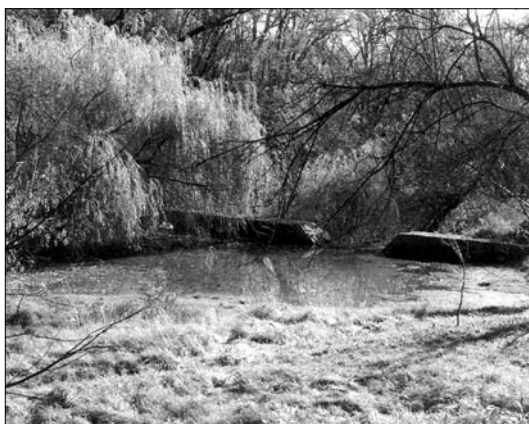
Rybniček v dolní části zmolý.