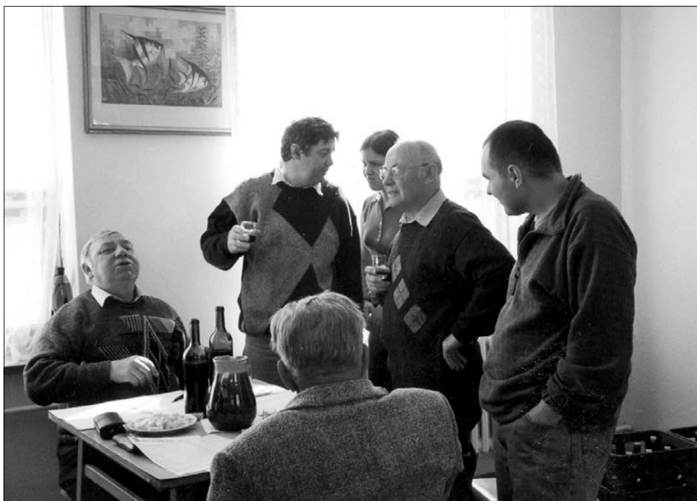
Po několika letech se „probudil“ košť vína.