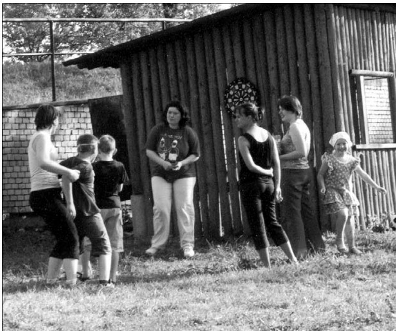
Dětský den provázela tropická vedra.

Jako každý rok, tak se i letos uskutečnily ve dnech 28. – 29. června Petropavlovské hodky. Na výletišťe Hliník se v sobotu vydalo za zábavu dvě stě sedmáct místních i přespolních občanů. K tanci a poslechu vyhrávala Staroměstská kapela, kterou doplňoval svými historkami lidový vypravěč. Pořadatele zaskočila vysoká návštěvnost a chvílkami se u stánků s občerstvením dokonce tvořily fronty. Přesto se všichni velmi dobře bavili. S úspěchem se setkala i připravená bohatá tombola. Následující den začal program v Hliníku v 15. hodin. I v neděli vylákalo pěkné počasí na vystoupení skupiny Trinom poměrně hodně občanů. Do areálu výletišťe přišlo čtyřiapadesát platících. Trinom se postaral o perfektní atmosféru a přidával jeden hit za druhým. Přespolním se muzika natolik zalíbila, že se složili a zaplatili hu-debníkům za další sady navíc. Petropavlovské hodky se vydařily a na ty příští, v roce 2004, se už teď těšíme. Doufáme, že vy také!