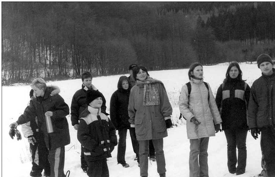
Výšlap na Vlčák.