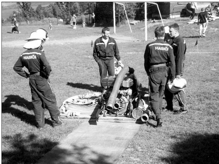
Hasiči SDH Újezdec při okrskové soutěži v požárním sportu v Medlovicích.

Chtěl bych tímto požádat občany, aby dbali opatrnosti a nezavdali příčinu ke vzniku požáru. Hlavně mám na mysli neuvážené pálení slámy, které bylo vloni příčinou požáru suché